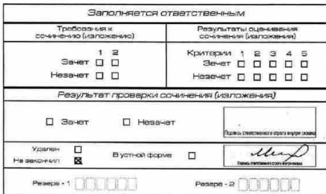
Рис. 12. Заполнение полей нижней части бланка регистрации (участник не закончил написание сочинения (изложения) по уважительным причинам)

поставить свою подпись в указанной форме). В бланке регистрации указанного участника итогового сочинения (изложения) необходимо внести отметку «X» в поле «Не закончил» для учета при организации проверки, а также для последующего допуска указанных участников к повторной сдаче итогового сочинения (изложения) в дополнительные сроки. Внесение отметки в поле «Не закончил» подтверждается подписью члена комиссии по проведению итогового сочинения (изложения) (см. рис. 12).