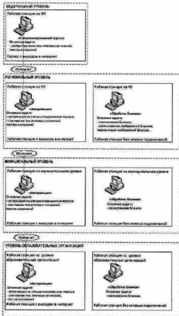
Рисунок 1. Архитектура и состав ПО

1. Схема ПО, используемого для проведения итогового сочинения (изложения), приведена на рисунке (см. Рисунок 1). На схеме приведены только новые или значительно модернизированные по сравнению со стандартной технологией проведения ЕГЭ модули и подсистемы