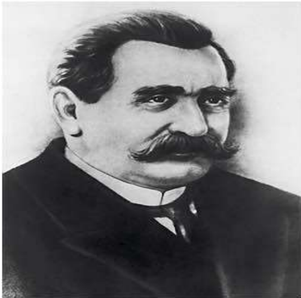
А. Н. Лодыгин

Прошло много лет, но человек продолжал искать новые способы удобного освещения своего жилища. Когда появилось электричество, Александр Лодыгин придумал электрическую лампочку.