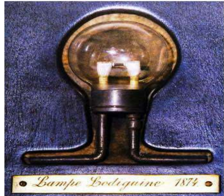
И его лампа накаливания